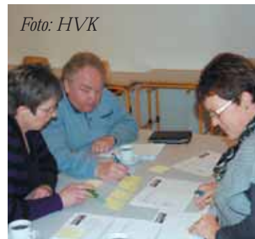
Fælles visionsdag i Astrup