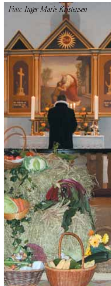
Ved årets høstgudstjeneste var der masser af frugt og grønt båret ind af børn ved gudstjenestens begyndelse