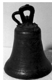
Messeklokken fra FASTER