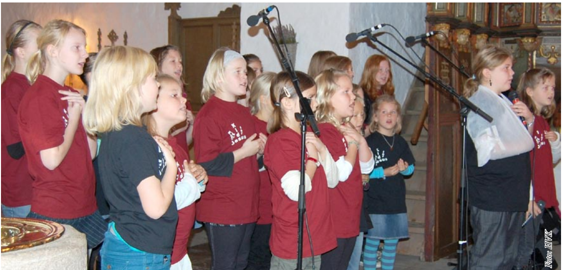
Gospel Kids fra Videbæk ved BUSK-gudstjenesten i Borris